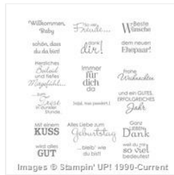
Perfekte Pärchen Clear-Mount Stamp Set (German) - 125307