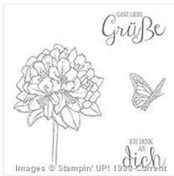
Gute Gedanken Clear-Mount Stamp Set (German) - 140035