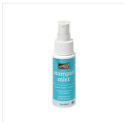
Stampin' Mist - 102394