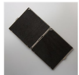
Stampin' Scrub Säuberungskissen - 126200