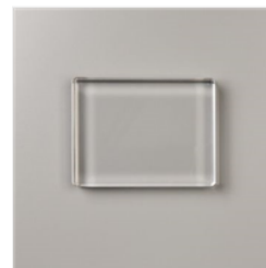
Stempelblock Transparent E - 118484