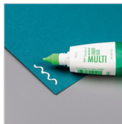
Multipurpose Liquid Glue - 110755