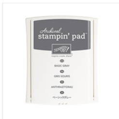
Basic Gray Archival Stampin' Pad - 140932