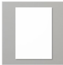
Farbkarton A4 Flüsterweiss - 106549