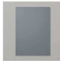
Farbkarton A4 Anthrazitgrau - 121689