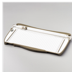
Stampin' Trimmer (Metric) - 129722